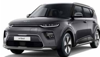
Gravity Grey (KDG)