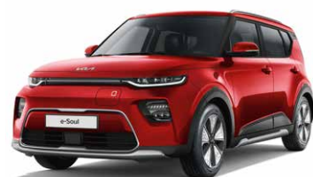
Inferno Red (AJR)