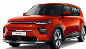
Mars Orange (M3R)