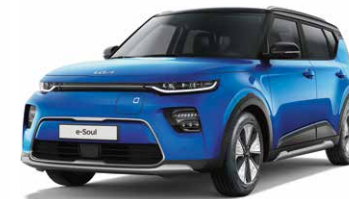
Neptune Blue + Cherry Black (SE2)