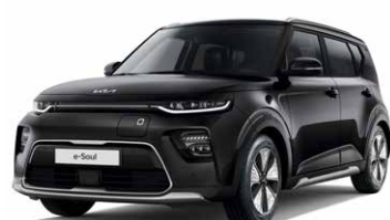
Cherry Black (9H)