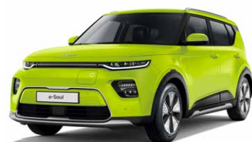
Space Cadet Green (CEJ)