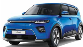
Neptune Blue (B3A)