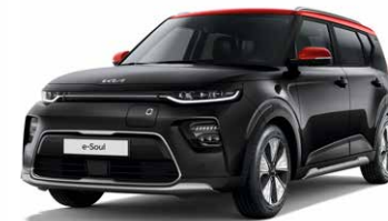
Cherry Black + Inferno Red (AH5)