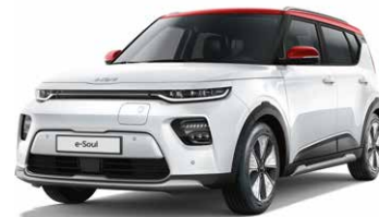
Clear White + Inferno Red (AH1)