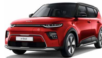
Inferno Red + Cherry Black (AH4)